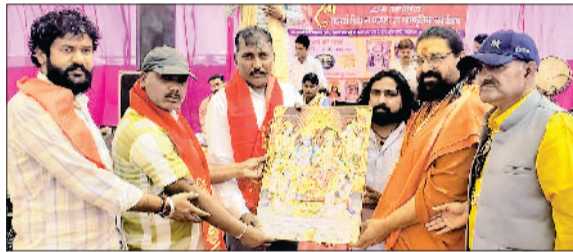
मिवानी। कार्यक्रम में अतिथि को स्मृति चिन्ह भेंट करते आयोजक।