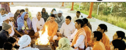
मिवानी। हवन में आहुति डालते दादी मसानी समाजसेवा समिति एवं ग्राम पंचायत तिवाला के सदस्य।