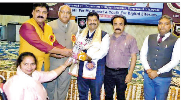
भिवानी। आयोजित शिविर में मुख्यअतिथि को सम्मानित करते हुए।

राष्ट्रीय सेवा योजना केवल एक कार्यक्रम नहीं, बल्कि युवाओं के सर्वांगीण विकास का सशक्त माध्यम है। स्वयंसेवक सेवा, सम्पन्न और अनुशासन की भावना को अपने जीवन में आत्मसात करें तथा समाज के कमजोर वर्गों के उत्थान में सक्रिय भूमिका निभाएं। यह बात उच्चतर शिक्षा विभाग हरियाणा द्वारा अनुमोदित वैश्य महाविद्यालय भिवानी की राष्ट्रीय सेवा योजना इकाइयों के तत्वाधान