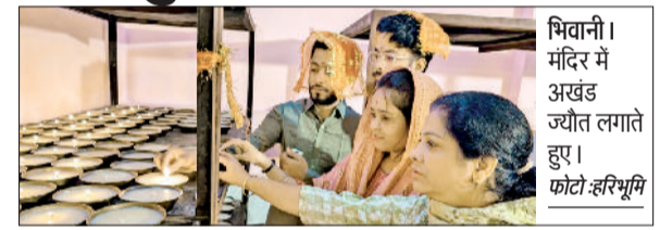
मिवानी। मंदिर में अखंड ज्योत लगाते हुए।

■ मिवानी का वह मंदिर, जिसकी ज्योत अखंड भारत की दिलाती है याद, पाकिस्तान से आए भक्त ने रखी थी वी