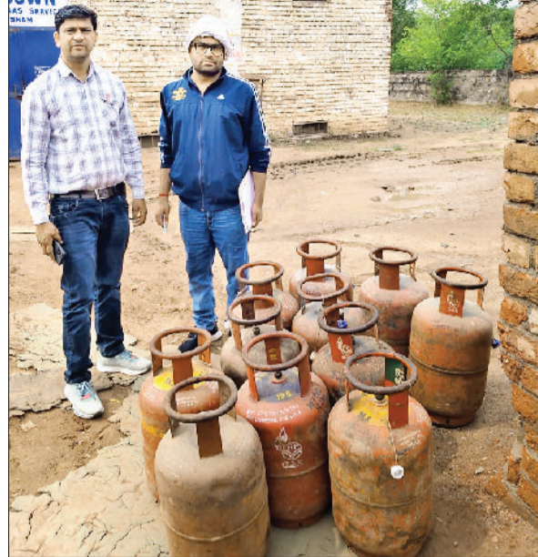
भिवानी। छापेमारी के दौरान घरेलू सिलेंडर जब्त करती टीम।

उसके मकान तथा टीन शेड के लिए प्रशासन तथा सरकार से मुआवजे की मांग की है। वहीं क्षेत्र के किसानों की खेतों में पककर पूरी तरह से तैयार खड़ी गेहूं व सरसों की फसल भी आंधी से पूरी तरह से बिछ गई और फसल बर्बाद होने से क्षेत्र के किसानों को काफी नुकसान हुआ है। इसी आंधी तूफान की चपेट में बिजली विभाग के विभिन्न खंभे तथा तार भी आ गए जिससे बिजली विभाग को भी खंभे-तार आदि क्षतिग्रस्त होने से लाखों रुपये का नुकसान हुआ है। आंधी-तूफान तथा बारिश से किसानों की फसलें बर्बाद होने से हुए नुकसान की भरपाई के लिए किसानों ने सरकार से मुआवजे की मांग की है।