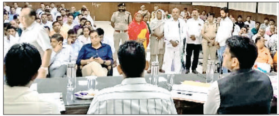
मिवानी। आयोजित खुले दरबार में लोगों की समस्याएं सुने उपायुक्त।