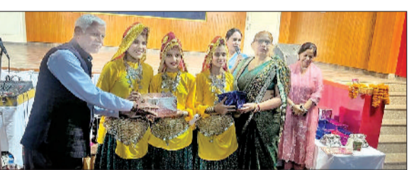
भिवानी। आयोजित कार्यक्रम में सम्मानित करते हुए।

कला, साहित्य व संस्कृति को समर्पित संस्था सांस्कृतिक मंच ने अपना 36 वां स्थापना महोत्सव कीर्ति नगर स्थित सांस्कृतिक सदन में बड़े धूमधाम से मनाया। आयोजन में मंच के परिवारजनों ने अपनी प्रस्तुतियाँ दी।